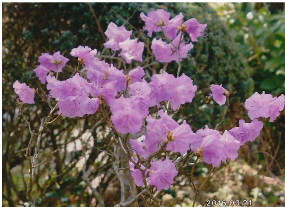
ミツバツツジ